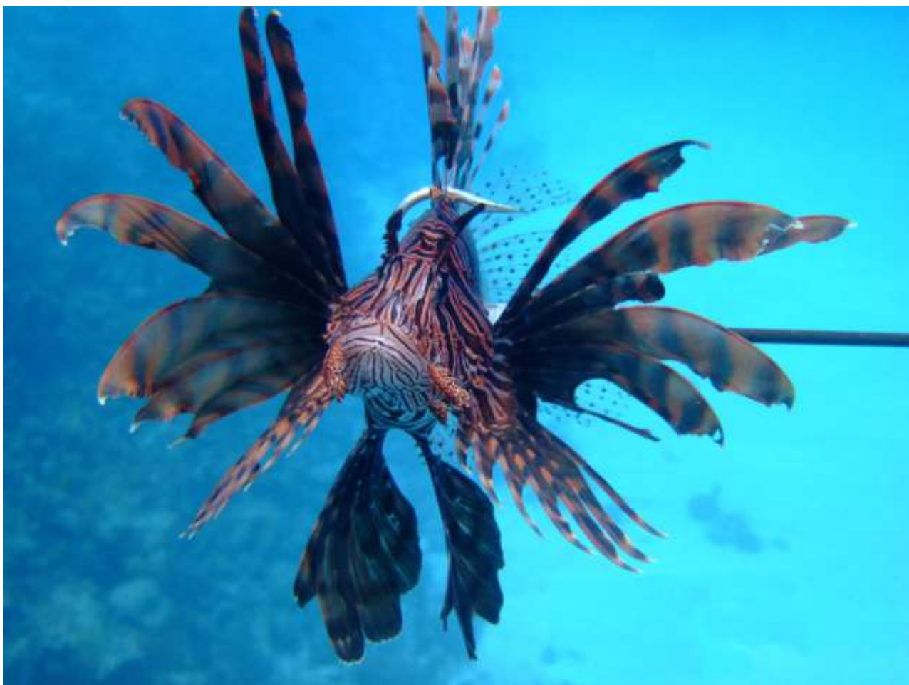
Cacería Pez león, San Andrés Isla 2010.

El apoyo de los centros de buceo, personas de la comunidad y ONG ha sido muy importante en la extracción de pez león en San Andrés y Providencia, un solo centro de buceo ha llegado a reportar capturas aproximadas a los 1200 individuos entre enero de 2009 y mayo de 2010 (Buzos del Caribe). En Providencia la ONG Old Providence EcoHamlet Foundation, reportó la captura de 339 individuos en dos salidas de campo realizadas en agosto de 2010. Actualmente se cuenta con un convenio suscrito entre dicha ONG y la Secretaria de Agricultura y Pesca del Departamento para adelantar otros trabajos de extracción, en los cuales han