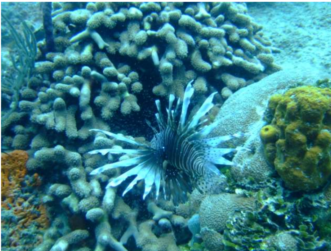
Pez león en una zona de conservación del Área Marina Protegida de San Andrés isla

De otra parte, algunas de las observaciones de campo realizadas por CORALINA han evidenciado que el pez león no solo se encuentra en San Andrés y Providencia, sino además en los cayos, bancos y bajos cercanos y remotos (Bolívar, Albuquerque, Roncador, Serrana, Quitasueño, Serranilla, Bajo Alicia y Bajo Nuevo), desde zonas someras a profundas, siendo el control en éstas últimas más difícil por el limitado tiempo de fondo que pueden tener los buzos (ejemplo a 130 ft). En zonas más profundas (cantiles) se han observado densidades relativamente altas (hasta 25 individuos durante un buceo de 20 minutos).