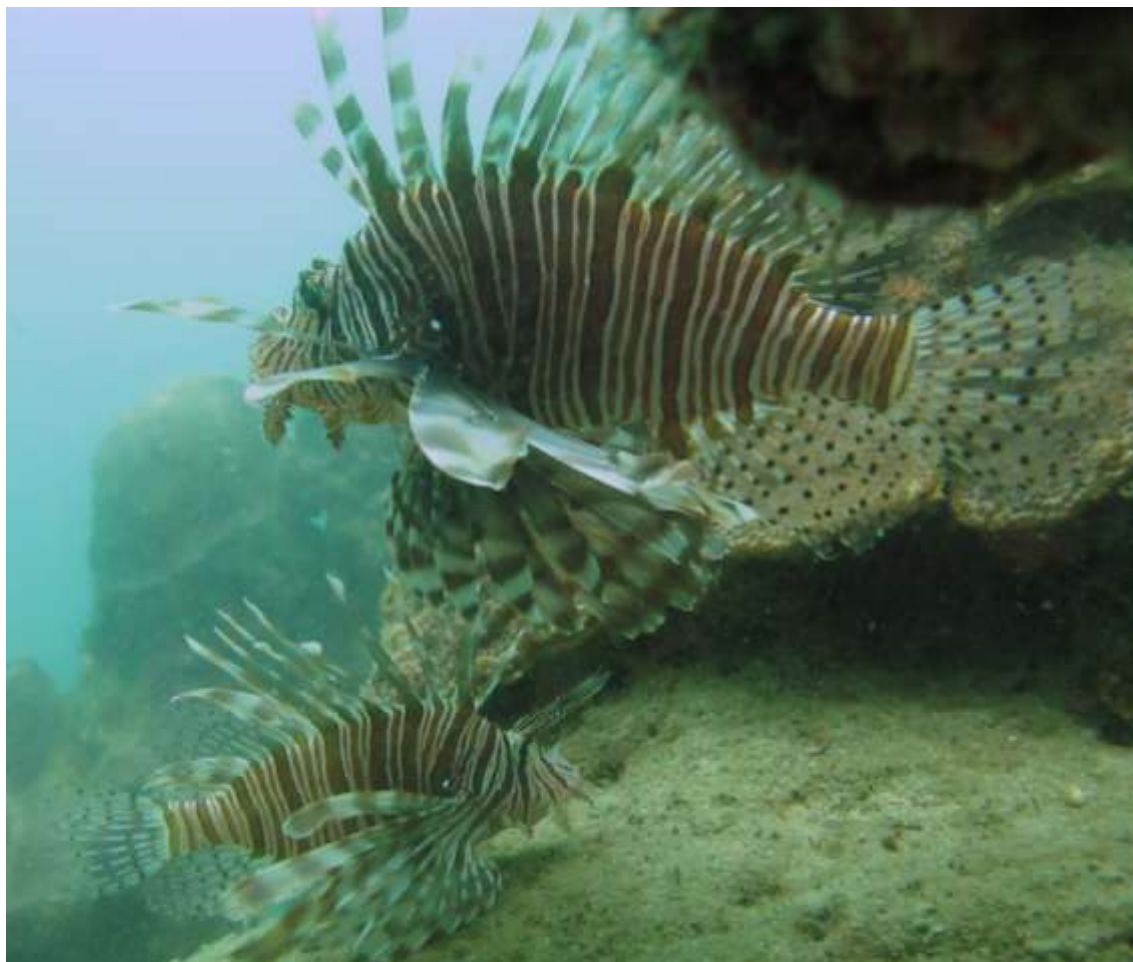
Pez león Parque Nacional Natural Tayrona.

En Colombia la especie Pterois volitans , fue registrada por primera vez a finales del año 2008 por buzos recreativos en la isla de Providencia quienes informaron a la Corporación para el Desarrollo Sostenible del Archipiélago de San Andrés, Providencia y Santa Catalina, CORALINA, quien reportó el avistamiento en la base de datos del Servicio Geológico de EE.UU. (USGS) con el fin de aportar la información al mapa de dispersión de la invasión del pez león en el Gran Caribe (USGS-NAS, 2011).