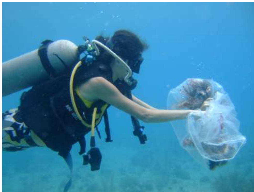
Jornada de caza de pez león de CORALINA en la isla de San Andrés 2010.

La extracción de individuos de pez león se ha llevado a cabo con diferentes métodos que van desde el empleo de bolsas plásticas transparentes, mallas, nasas, la clásica red de “toldillo”, ganchos (fabricados con un anzuelo grande, atado a un soporte), arpones, y lanzas Hawaiianas (“hawaiian slings”), entre otros, y se ha contado con la participación de las instituciones ya mencionadas, escuelas de buceo, ONG, pescadores artesanales y representantes de las comunidades locales de las zonas con presencia de la especie.