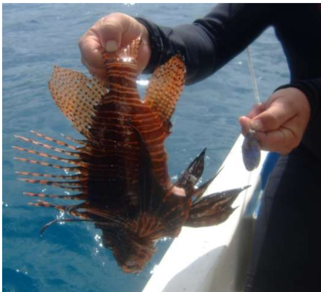
Registro del Pez león más grande capturado hasta el momento (42 cm) en la isla de San Andrés.

Igualmente se ha observado que las densidades y el tamaño de los individuos han aumentado especialmente en las zonas en las que no se realiza mayor control, de este modo, se han observado densidades de 12 individuos alrededor de una sola esponja barril y se han capturado peces de más de 40 cm, siendo 42 cm el mayor tamaño registrado hasta el momento, el cual fue capturado por un instructor del centro de buceo Blue Life en San Andrés en agosto de 2011.