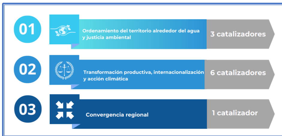
Figura 2: Alineación PICIA al PND