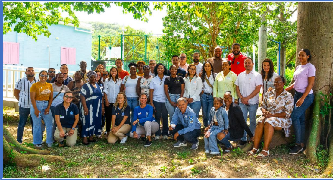
Imagen 3: Primera sesión de la mesa de trabajo territorial en el Archipiélago, un espacio de diálogo colectivo orientado a fortalecer la gestión sostenible y la protección ambiental del territorio.

identificaron 47 puntos críticos de residuos y se implementaron pilotos de vasos reutilizables en hoteles y restaurantes para reducir el plástico de un solo uso, además de realizar jornadas de limpieza comunitaria en el sector de El Cove, donde se recolectaron 208 kg de desechos.