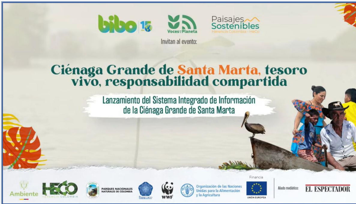
Imagen 8: Lanzamiento del SIICGSM