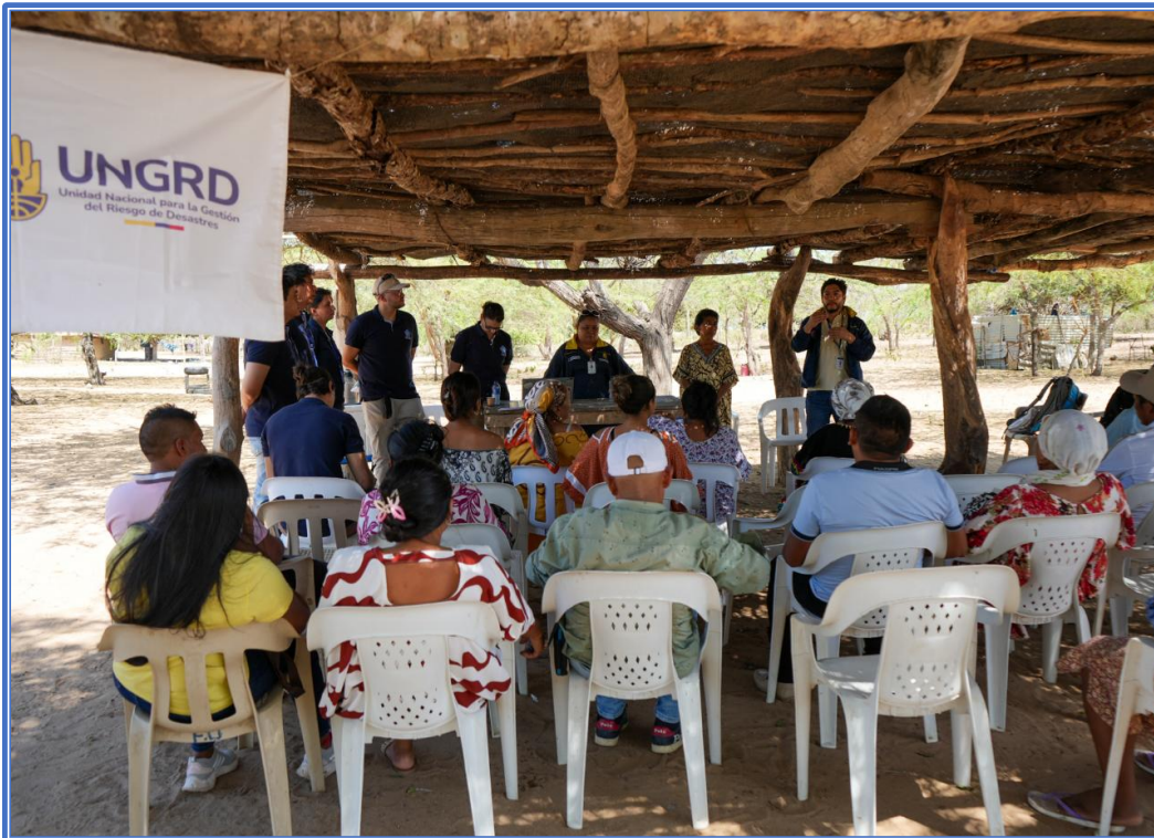
Imagen 2: participación activa de miembros de la comunidad Wayuu del sector La Cachaca III, en La Guajira