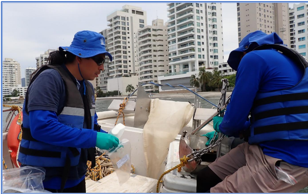
Imagen 4: Monitoreo REDCAM en playas de Santa Marta