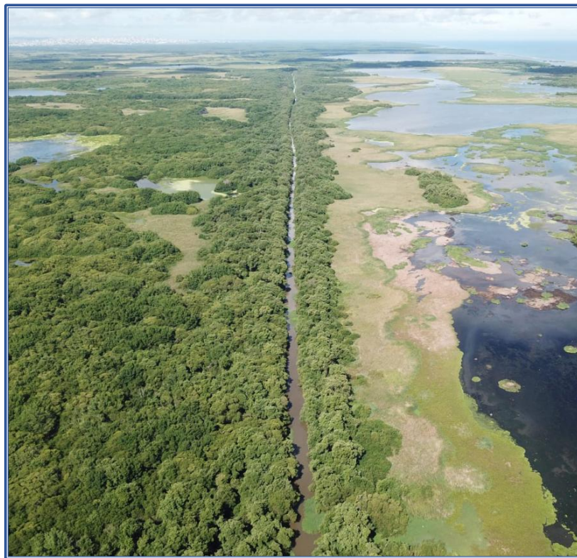
Imagen 7: Canal Clarín donde se implementó un monitoreo participativo