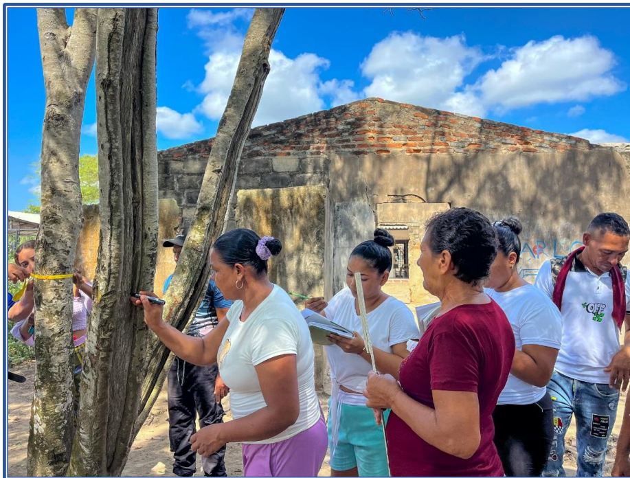
Imagen 6: En Remolino, 20 personas de la comunidad participaron en un proceso de formación práctica para el monitoreo del ecosistema de manglar,