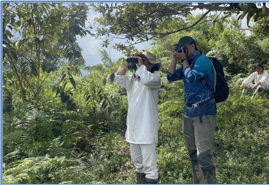
Imagen 1: Visita de trabajo a la comunidad indígena Kogui de Setaminaka, ubicada en la Sierra Nevada de Santa Marta, con el propósito de reconocer el territorio y planificar acciones conjuntas de conservación y restauración del bosque de galería o bosque ribereño.