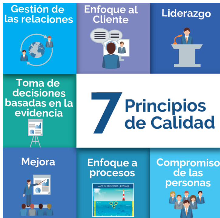
Figura 3 Siete principios de calidad

De igual forma adquiere el compromiso de adoptar y desarrollar lo definido en la Directriz, los Objetivos y los principios de calidad: