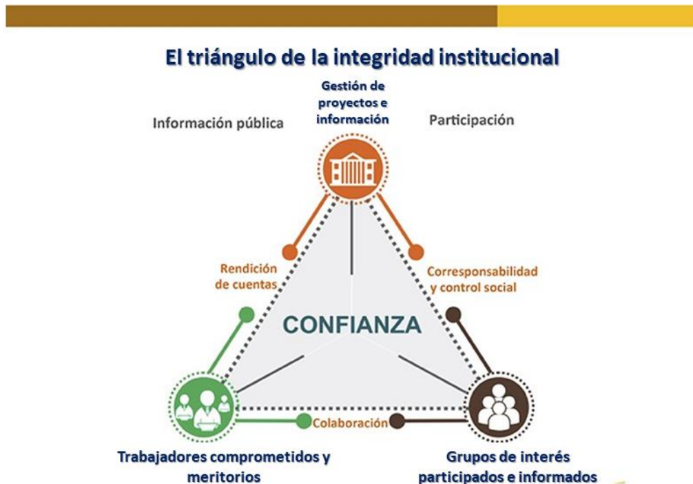
Figura 1. Triangulo de la integridad Institucional

La política de integridad constituye uno de los dos componentes de la dimensión de Talento Humano, el cual es gestionado en lo aplicable por el Invemar, la cual busca la gestión transparente, honesta y en desarrollo del interés general en el cumplimiento del deber misional.