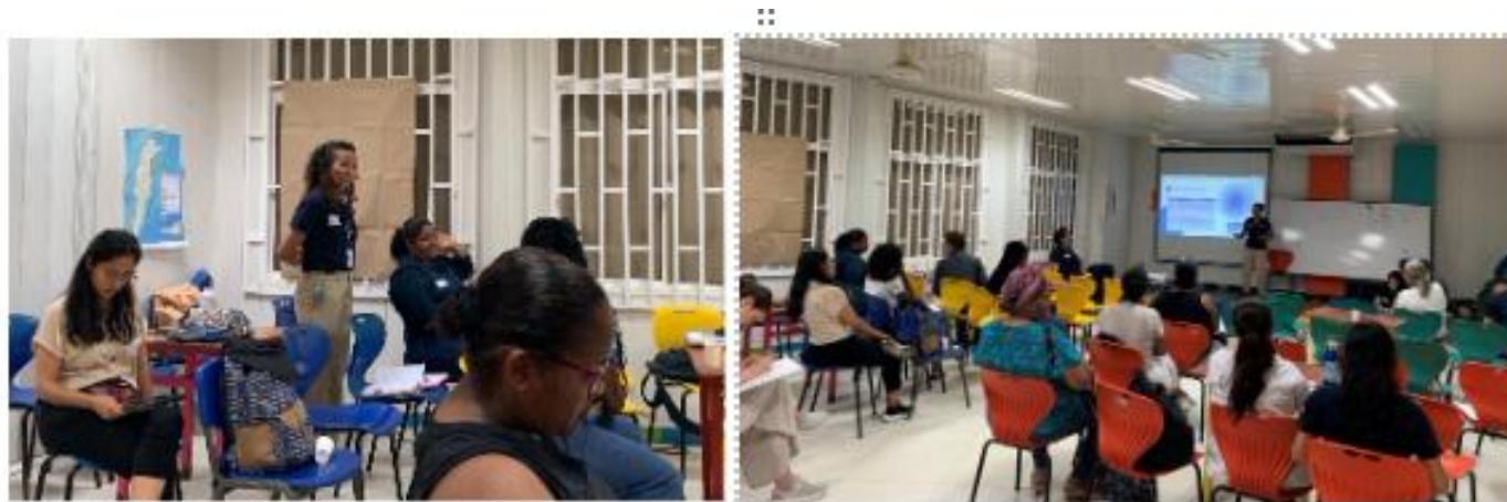
Figura 1. Espacio de instalación del taller en la Isla de San Andrés.

A pesar de que la comunidad posee un entendimiento del territorio y tiene alto interés en involucrarse en acciones de restauración, se considera que se requiere mayor apoyo técnico, institucional y formativo.