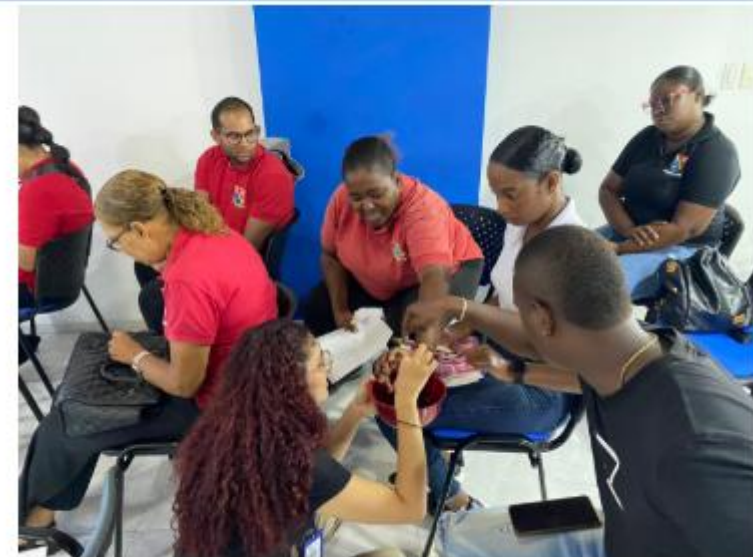
Actividad para reconocer e identificar las diferencias entre pastos y algas marinas.