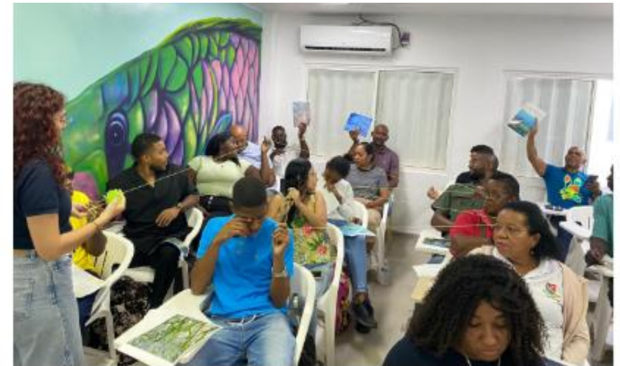
Actividad lúdica de conectando las redes de los pastos marinos.