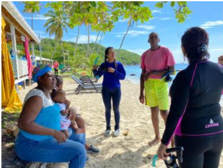
Explicación de actividad práctica de reconocimiento de pastos marinos en la playa Manzanil (Providencia).

Se identificó la importancia de contar con material vivo que los participantes puedan observar y manipular para un mayor entendimiento e igualmente la presentación de situaciones reales como servicios y amenazas de estos ecosistemas.