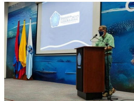
Cumbre Marino Costera del Sistema Nacional Marino 11 de junio

https://www.facebook.com/invemar.org/videos/521402688898507